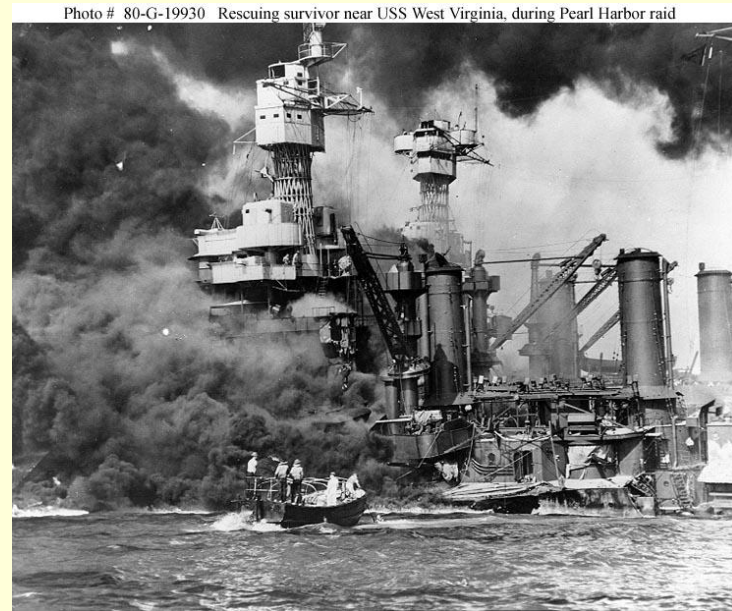
Attaque de Pearl Harbor