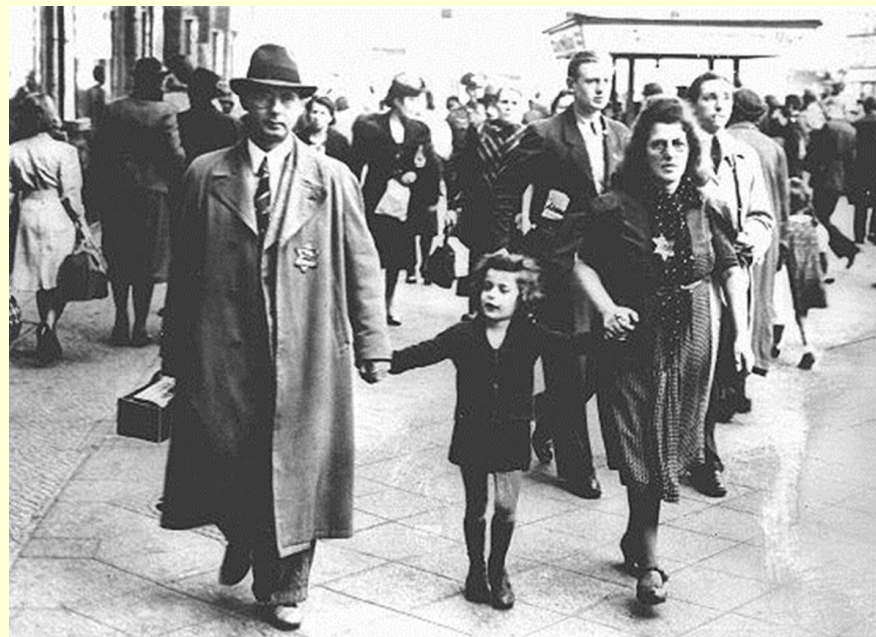
Le port de l'étoile jaune